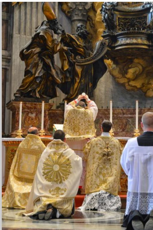
Messe à Saint-Pierre de Rome célébrée par le Cardinal Raymond Burke le samedi 25 octobre 2014 à l'occasion du pèlerinage Populus Summorum Pontificum