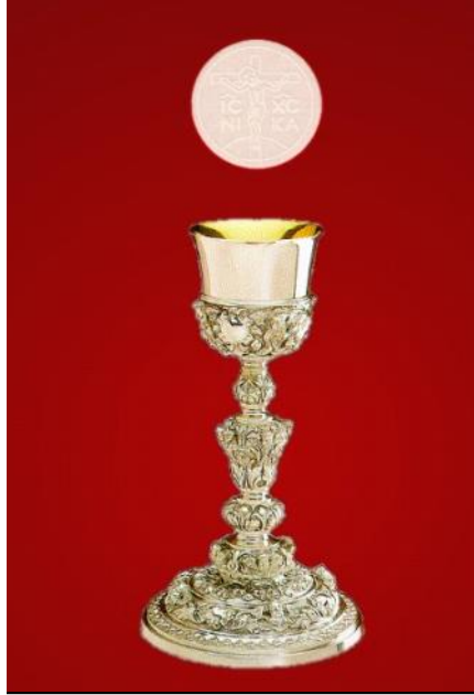
« Du Sacrement de l'Eucharistie découle une exigence continue de conversion. » St Jean-Paul II

Le respect de la totalité des liens invisibles est un devoir moral strict pour le chrétien qui veut participer pleinement à l'Eucharistie en communiant au corps et au sang du Christ. Le même Apôtre rappelle ce devoir au fidèle par l'avertissement: « Que chacun, donc, s'éprouve